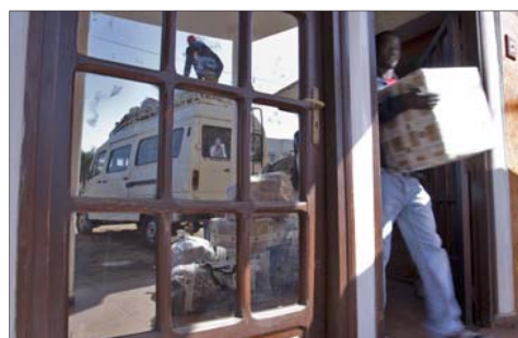
Cargando el material sanitario en Dakar.

Por otra parte, el trabajo de campo de estos profesionales sanitarios gallegos les ha mostrado que la práctica de la ablación es habitual en casi todas las mujeres mayores de 30 años y, aunque aún encuentran bastantes casos de mutilación genital en las menores de esa edad a pesar de estar prohibido en el país, “poco a poco parece que se va eliminando”. “También hemos dado algunas charlas sobre este tema y sobre control de natalidad”, añade la pediatra. En estos momentos, han conseguido que 45 mujeres de Dindéfelo lleven un dispositivo tipo DIU para evitar embarazos durante cinco años. “Convencerlas de algo así no era a priori nada sencillo, por eso lo consideramos todo un éxito”, destaca la pediatra.