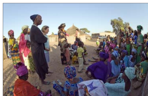
Un momento de una charla sobre prevención e higiene.