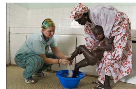
Aurora lava un niño con problemas de piel antes de tratarlo.