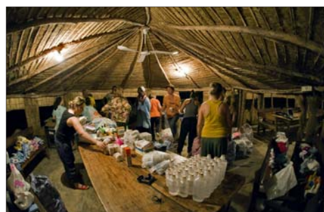
Miembros de Da Man ordenando el material en Boulen.